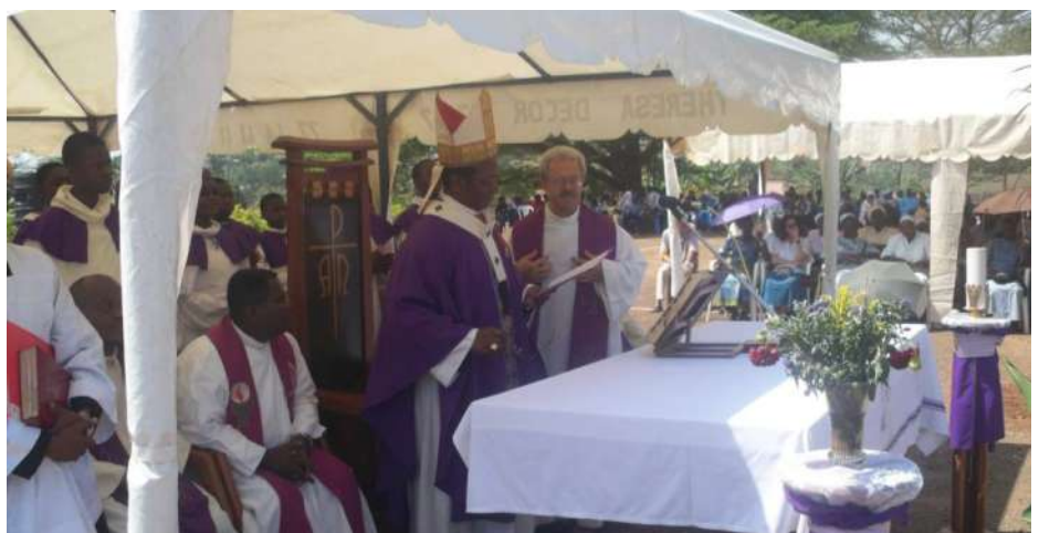
Célébration Eucharistique le 3 Avril 2011