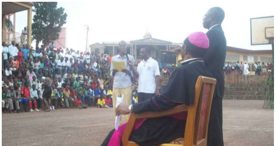
Rencontre avec les jeunes du Centre Don Bosco le 2 avril 2011