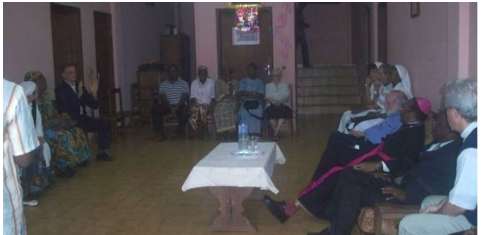
Rencontre avec tous les religieux du territoire paroissial le 2 avril 2011